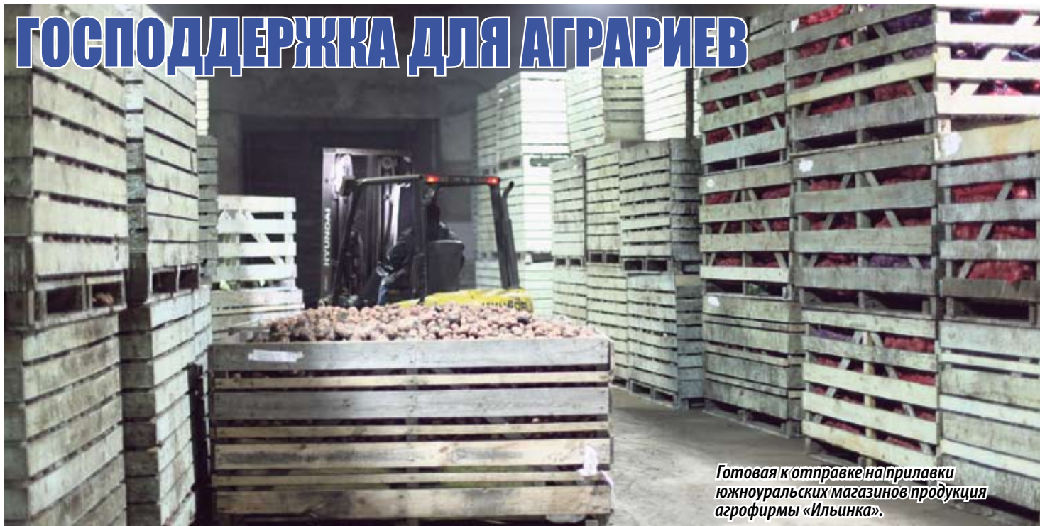
Готовая к отправке на прилавки южноуральских магазинов продукция агрофирмы «Ильинка».