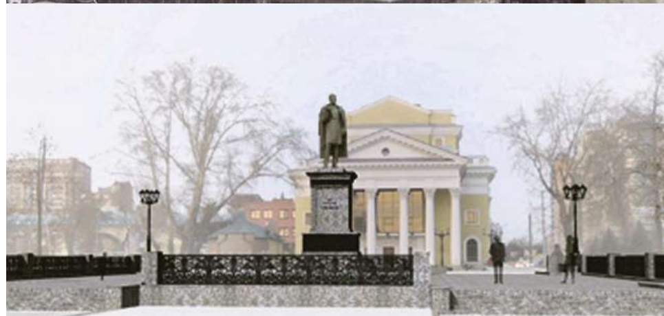
АВТОР ПРОЕКТА ПАМЯТНИКА – СКУЛЬПТОР АНТОН ПЛОХОЦКИЙ.