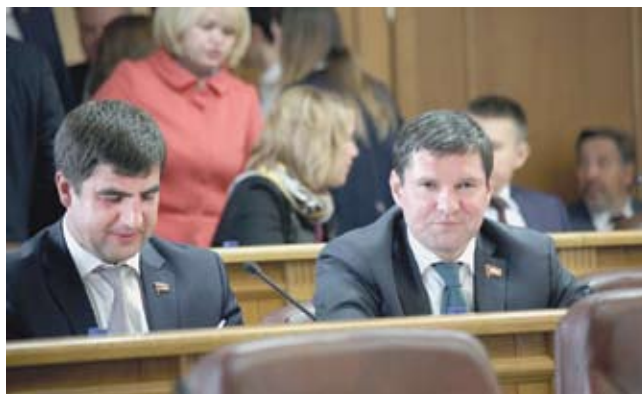
Депутаты фракции ЛДПР