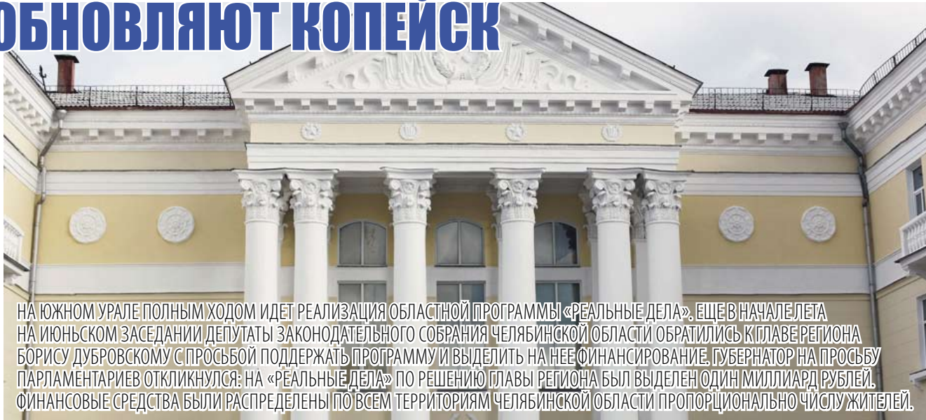
НА ЮЖНОМ УРАЛЕ ПОЛНЫМ ХОДОМ ИДЕТ РЕАЛИЗАЦИЯ ОБЛАСТНОЙ ПРОГРАММЫ «РЕАЛЬНЫЕ ДЕЛА». ЕЩЕ В НАЧАЛЕ ЛЕТА НА ИЮНСКОМ ЗАСЕДАНИИ ДЕПУТАТЫ ЗАКОНОДАТЕЛЬНОГО СОБРАНИЯ ЧЕЛЯБИНСКОЙ ОБЛАСТИ ОБРАТИЛИСЬ К ГЛАВЕ РЕГИОНА БОРИСУ ДУБРОВСКОМУ С ПРОСЬБОЙ ПОДДЕРЖАТЬ ПРОГРАММУ И ВЫДЕЛИТЬ НА НЕЕ ФИНАНСИРОВАНИЕ. ГУБЕРНАТОР НА ПРОСЬБУ ПАРЛАМЕНТАРИЕВ ОТКЛИКНУЛСЯ: НА «РЕАЛЬНЫЕ ДЕЛА» ПО РЕШЕНИЮ ГЛАВЫ РЕГИОНА БЫЛ ВЫДЕЛЕН ОДИН МИЛЛИАРД РУБЛЕЙ. ФИНАНСОВЫЕ СРЕДСТВА БЫЛИ РАСПРЕДЕЛЕНЫ ПО ВСЕМ ТЕРРИТОРИЯМ ЧЕЛЯБИНСКОЙ ОБЛАСТИ ПРОПОРЦИОНАЛЬНО ЧИСЛУ ЖИТЕЛЕЙ.