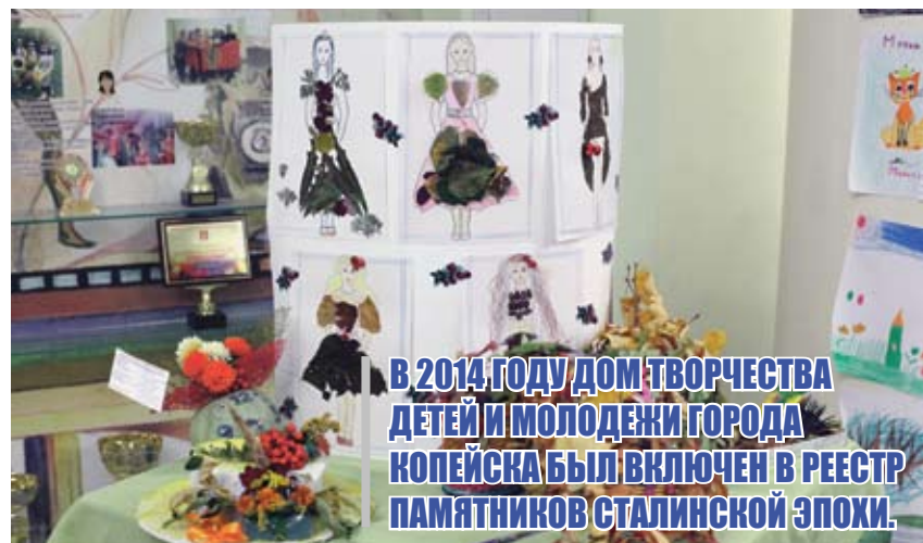
В 2014 ГОДУ ДОМ ТВОРЧЕСТВА ДЕТЕЙ И МОЛОДЕЖИ ГОРОДА КОПЕЙСКА БЫЛ ВКЛЮЧЕН В РЕЕСТР ПАМЯТНИКОВ СТАЛИНСКОЙ ЭПОХИ.

ДВОРЦУ ТВОРЧЕСТВА ДЕТЕЙ И МОЛОДЕЖИ ГОРОДА КОПЕЙСКА ВЕРНУЛИ ИСТОРИЧЕСКИЙ ОБЛИК. В НАСТОЯЩЕЕ ВРЕМЯ МЕСТНЫЙ ДК ВЫГЛЯДИТ ТАКИМ ЖЕ, КАКИМ ОН БЫЛ ПОСТРОЕН ЕЩЕ В ДАЛЕКОМ 1956 ГОДУ. ВО МНОГОМ ТАКОЕ ПРЕОБРАЖЕНИЕ СТАЛО ВОЗМОЖНЫМ ИМЕННО БЛАГОДАРЯ ПРОГРАММЕ «РЕАЛЬНЫЕ ДЕЛА».