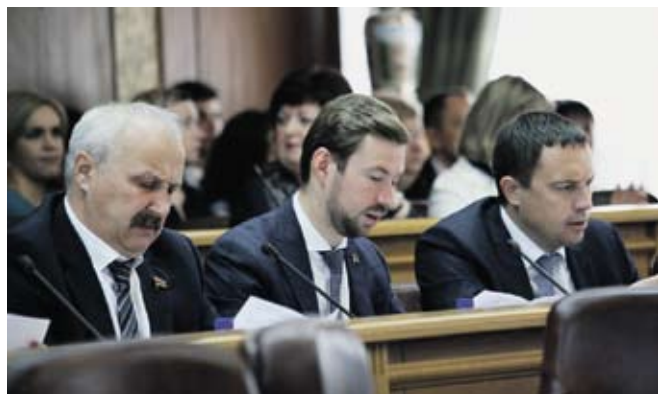
Депутаты фракции «Справедливая Россия»