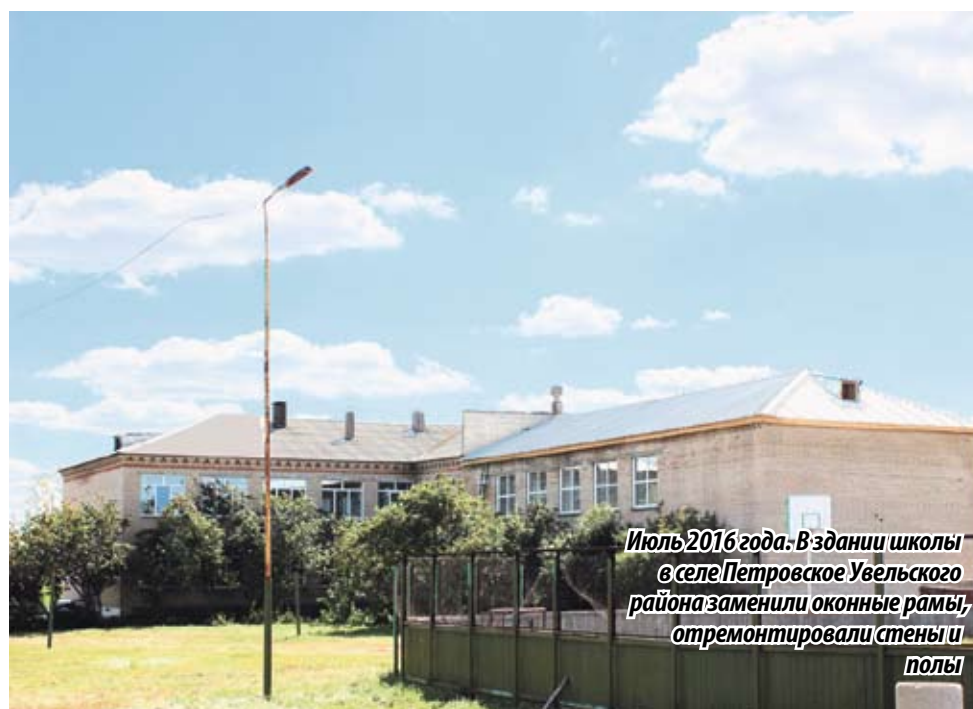
Июль 2016 года. В здании школы в селе Петровское Увельского района заменили оконные рамы, отремонтировали стены и полы

ОБЛАСТНАЯ ПРОГРАММА «РЕАЛЬНЫЕ ДЕЛА» ЗАВЕРШИЛАСЬ В ДЕКАБРЕ 2016 ГОДА. В ОБЩЕЙ СЛОЖНОСТИ В РАМКАХ ПРОГРАММЫ БЫЛО ВЫПОЛНЕНО 4 657 МЕРОПРИЯТИЙ. НА КОНЕЦ ЯНВАРЯ 2017 ГОДА В 45 МУНИЦИПАЛЬНЫХ ОБРАЗОВАНИЯХ ВЫПОЛНЕНЫ ВСЕ МЕРОПРИЯТИЯ. ОБЩАЯ ЦЕНА ВОПРОСА — 953,8 МИЛЛИОНА РУБЛЕЙ. ДЕСЯТИ МУНИЦИПАЛИТЕТАМ УДАЛОСЬ СЭКОНОМИТЬ СРЕДСТВА, ОНИ, КСТАТИ, БУДУТ НАПРАВЛЕННЫ НА РЕШЕНИЕ ДРУГИХ СОЦИАЛЬНО ЗНАЧИМЫХ ВОПРОСОВ.