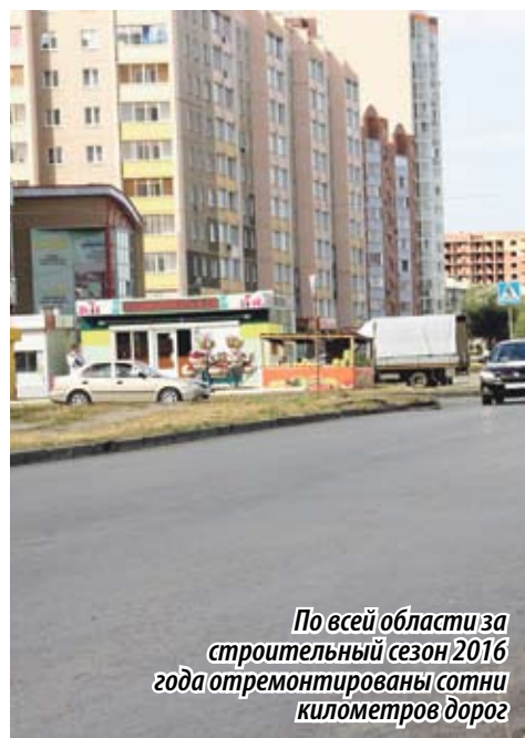
По всей области за строительный сезон 2016 года отремонтированы сотни километров дорог

крытия ДК. – Из наказов избирателей, прозвучавших во время выборов 2016 года, родился новый партийный проект «Местный дом культуры». На его реализацию уже предусмотрено 51,8 миллиона рублей. Из них 38 миллионов – средства федерального бюджета, остальная сумма – деньги областного бюджета.