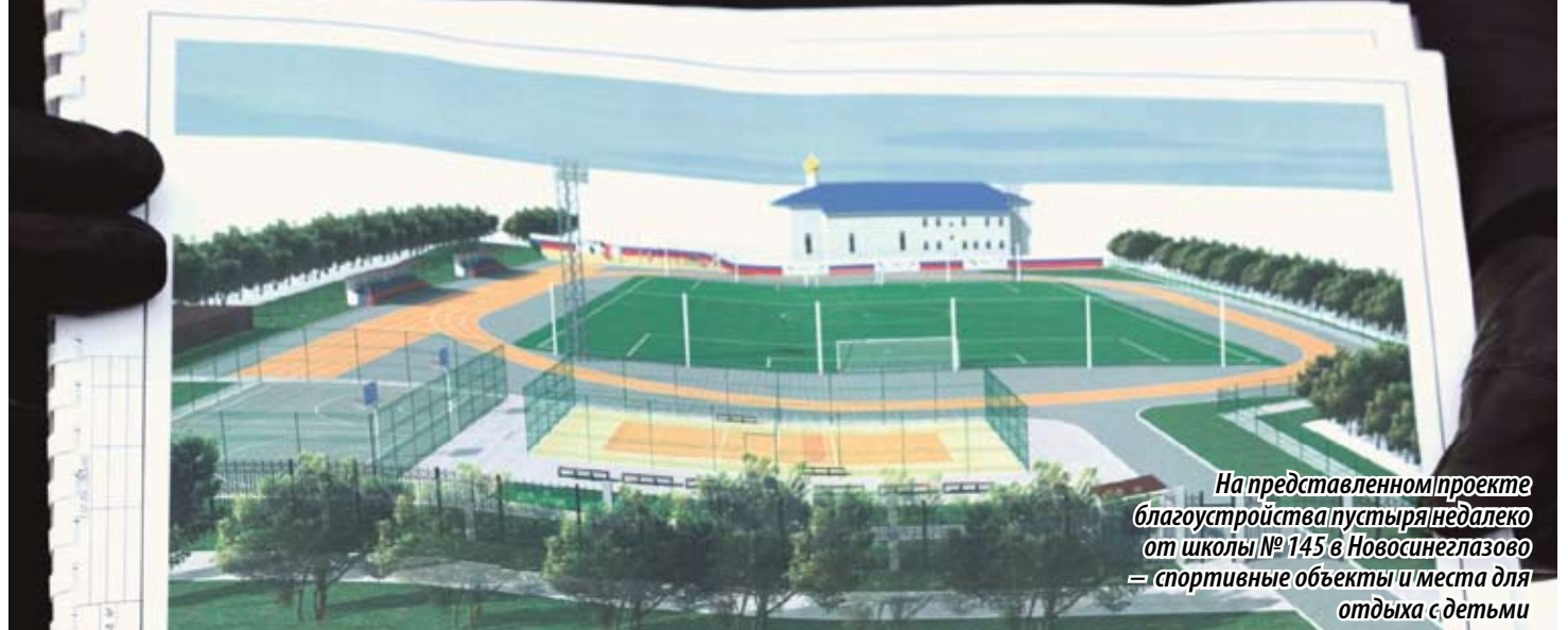
На представленном проекте благоустройства пустыря недалеко от школы № 145 в Новосинеглазово — спортивные объекты и места для отдыха с детьми

— У нас очень хороший двор. Есть деревья,