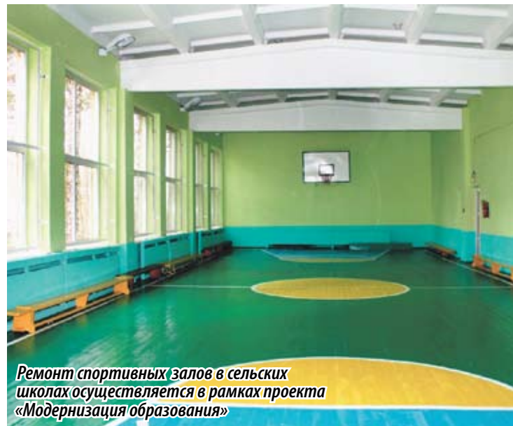
Ремонт спортивных залов в сельских школах осуществляется в рамках проекта «Модернизация образования»

В КОНЦЕ ПРОШЛОЙ НЕДЕЛИ В ОБЛАСТНОМ ПАРЛАМЕНТЕ СОСТОЯЛОСЬ ЗАСЕДАНИЕ КООРДИНАЦИОННОГО СОВЕТА ПО РЕАЛИЗАЦИИ ПРОЕКТА «ЕДИНОЙ РОССИИ» «МОДЕРНИЗАЦИЯ ОБРАЗОВАНИЯ». УЧАСТНИКИ ВСТРЕЧИ ПОДВЕЛИ ИТОГИ РЕАЛИЗАЦИИ ПРОЕКТА, А ТАКЖЕ ОБОЗНАЧИЛИ ЗАДАЧИ НА ПРЕДСТОЯЩИЙ ГОД.