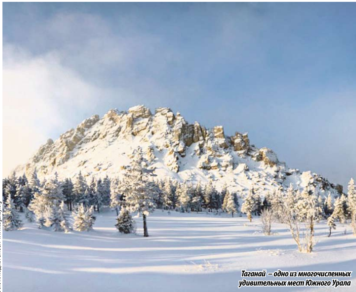
Таганай – одно из многочисленных удивительных мест Южного Урала