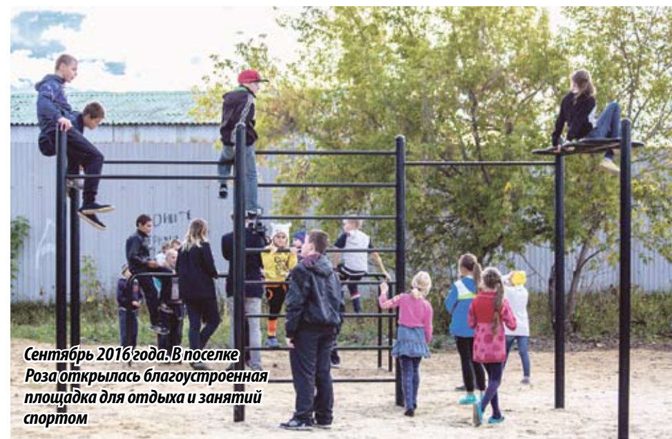
Сентябрь 2016 года. В поселке Роза открылась благоустроенная площадка для отдыха и занятий спортом

ОБЛАСТНАЯ ПРОГРАММА «РЕАЛЬНЫЕ ДЕЛА» ЗАВЕРШИЛАСЬ В ДЕКАБРЕ 2016 ГОДА. В ОБЩЕЙ СЛОЖНОСТИ В РАМКАХ ПРОГРАММЫ БЫЛО ВЫПОЛНЕНО 4 657 МЕРОПРИЯТИЙ. НА КОНЕЦ ЯНВАРЯ 2017 ГОДА В 45 МУНИЦИПАЛЬНЫХ ОБРАЗОВАНИЯХ ВЫПОЛНЕНЫ ВСЕ МЕРОПРИЯТИЯ. ОБЩАЯ ЦЕНА ВОПРОСА — 953,8 МИЛЛИОНА РУБЛЕЙ. ДЕСЯТИ МУНИЦИПАЛИТЕТАМ УДАЛОСЬ СЭКОНОМИТЬ СРЕДСТВА, ОНИ, КСТАТИ, БУДУТ НАПРАВЛЕННЫ НА РЕШЕНИЕ ДРУГИХ СОЦИАЛЬНО ЗНАЧИМЫХ ВОПРОСОВ.