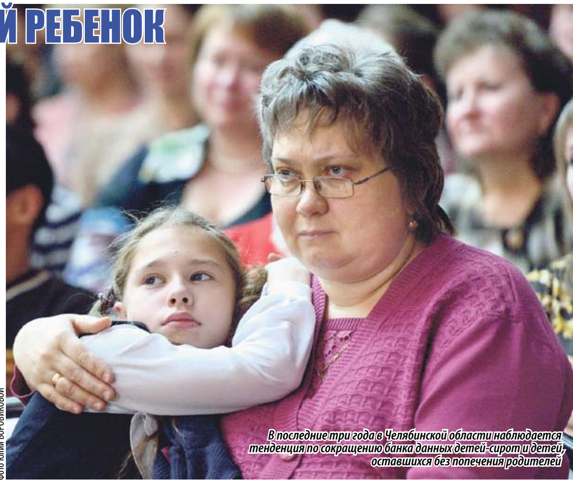
В последние три года в Челябинской области наблюдается тенденция по сокращению банка данных детей-сирот и детей, оставшихся без попечения родителей

Стоит отметить, что в рамках проекта «России важен каждый ребенок» был проведен масштабный мониторинг банка данных детей-сирот. Проанализировав результаты мониторинга, члены рабочей группы пришли к выводу, что в Челябинской области тенденция к сокращению банка данных детей-сирот и детей,