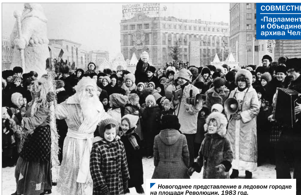
Новогоднее представление в ледовом городке на площади Революции, 1983 год.