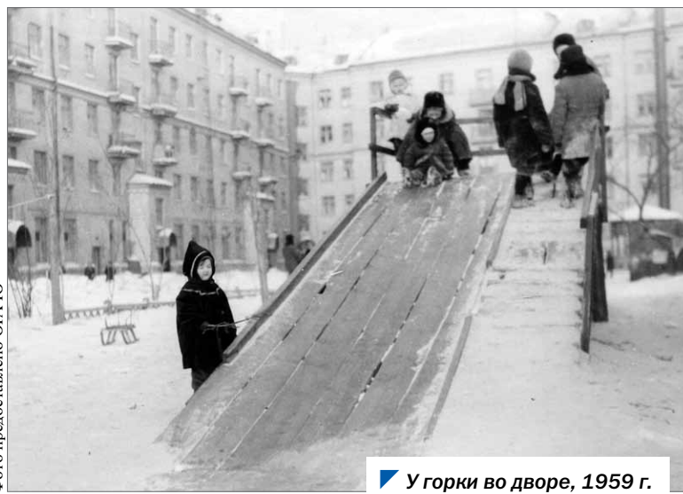
У горки во дворе, 1959 г.

В 1943 году по предложению начальника Челябинского управления издательств и полиграфии Н. Г. Бельмана было налажено производство игрушек из папье-маше, выгодного во всех смыслах материала (легкий, экономичный, несложный в работе). Для него требовалась всего лишь макулатура (ненужные документы, бумажные обрезки