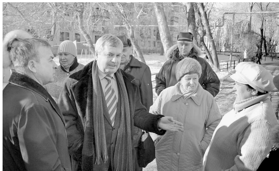
Владимир Мякуш часто встречается с людьми, и по-прежнему родным для него остается Металлургический район Челябинска. На фото: встреча с избирателями округа.

Поэтому и первые его шаги «в кабинетах и президиуме» были сделаны прежде всего навстречу людям. В должности замначальника по кадрам и быту ЧМС Мякуш занялся вопросами