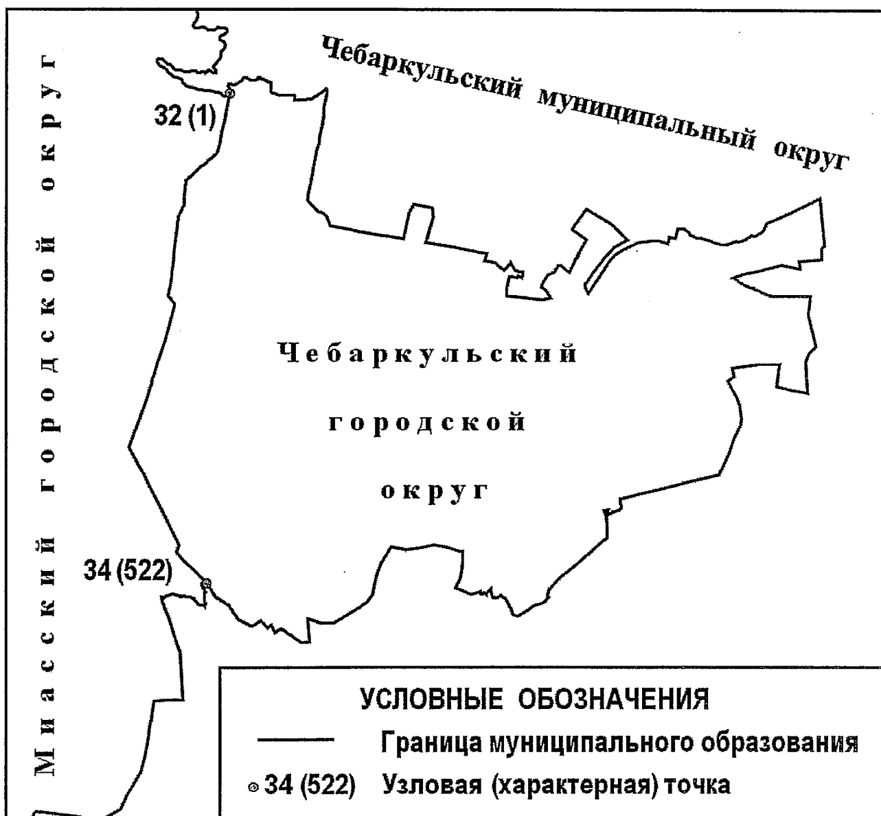
СХЕМА ГРАНИЦ Чебаркульского городского округа

«Приложение 2 к Закону Челябинской области «О статусе и границах Чебар- кульского городского округа Челябинской области»