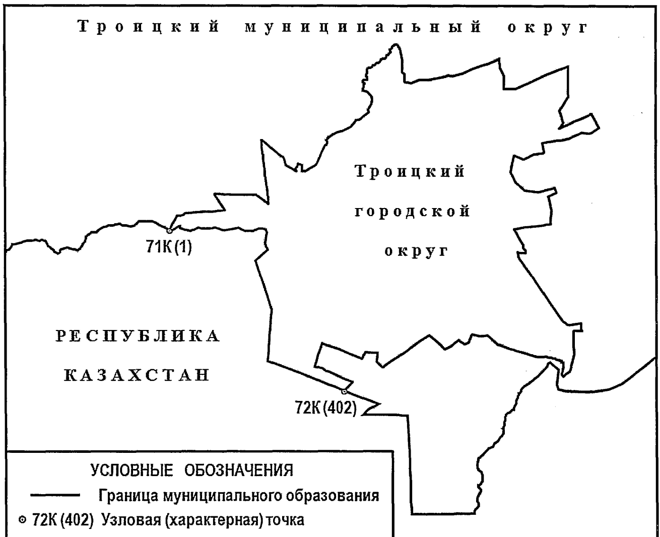
СХЕМА ГРАНИЦ Троицкого городского округа

«Приложение 2 к Закону Челябинской области «О статусе и границах Троицкого городского округа Челябинской области»