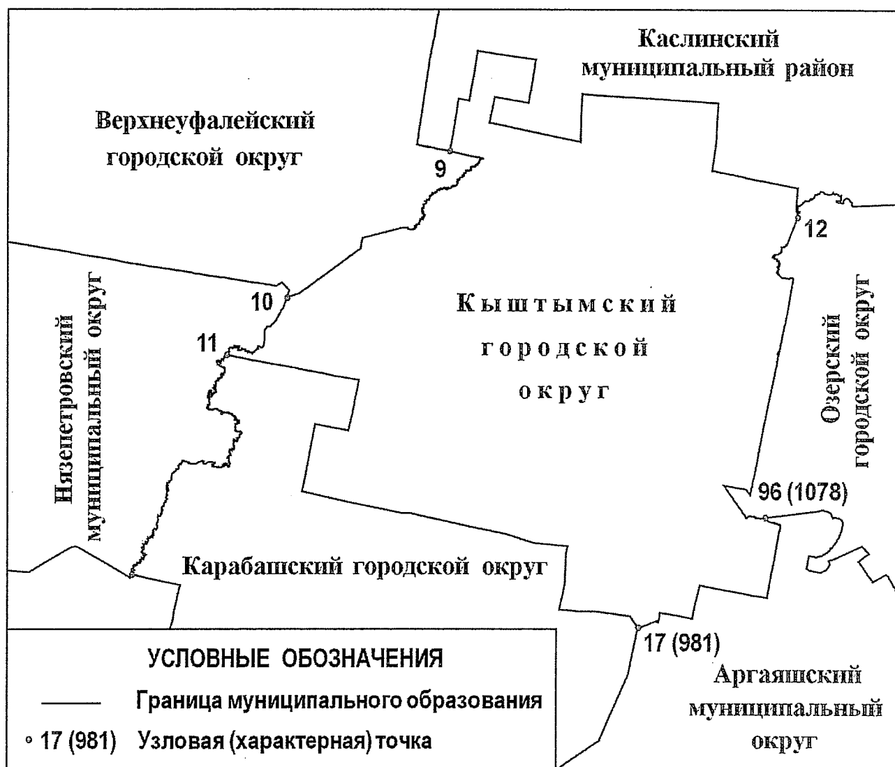
СХЕМА ГРАНИЦ Кыштымского городского округа

«Приложение 2 к Закону Челябинской области «О статусе и границах Кыштымского городского округа Челябинской области»