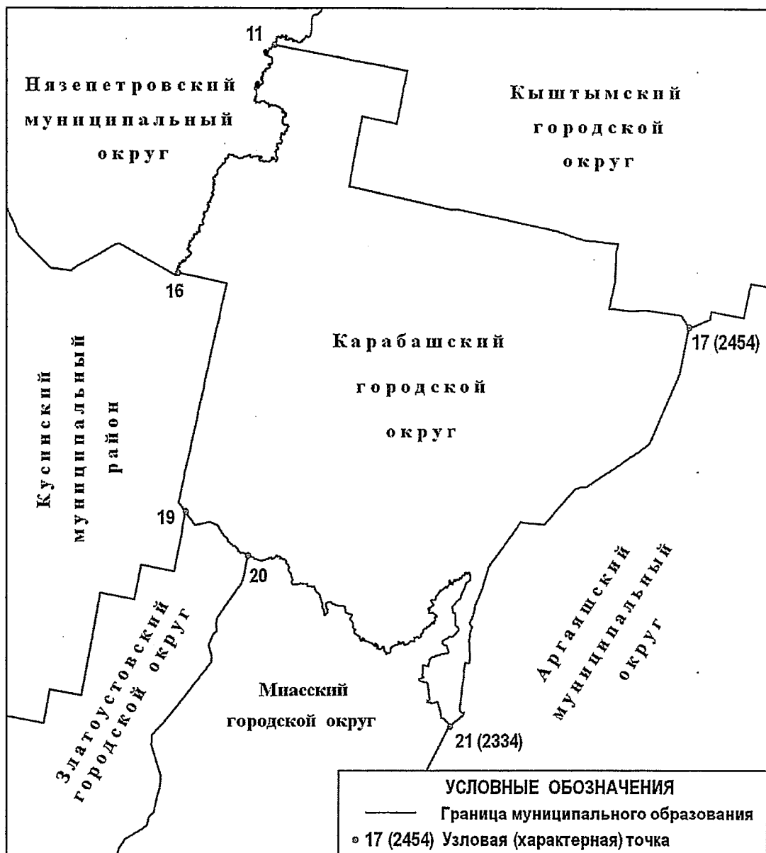
СХЕМА ГРАНИЦ Карабашского городского округа

«Приложение 2 к Закону Челябинской области «О статусе и границах Карабаш- ского городского округа Челябинской области»